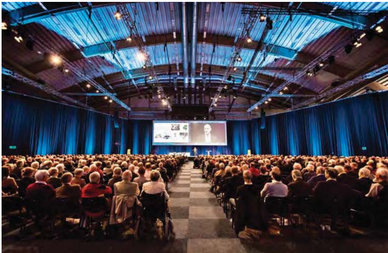
Välbesökt årsstämma den 7 maj 2015 på Göransson Arena i Sandviken.