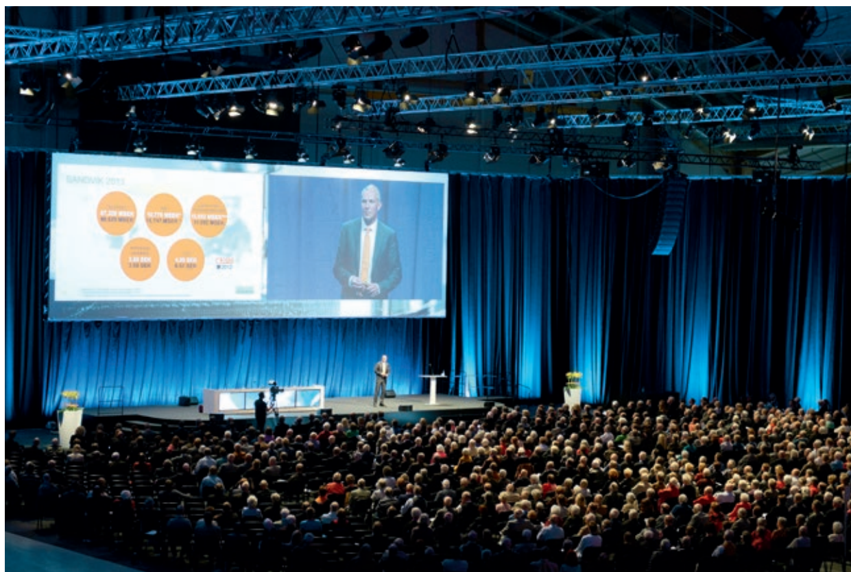
Välbesökt årsstämma den 13 maj 2014 på Göransson Arena i Sandviken.

Alla aktieägare som är upptagna i aktieboken och som till bolaget har anmält sitt deltagande inom den tid som föreskrivs i kallelsen till stämman har rätt att delta i Sandviks stämmor och rösta för sina aktier. Aktieägare kan även företrädas av ombud vid stämman.